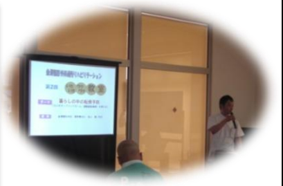
いきいきワクワク教室の写真です